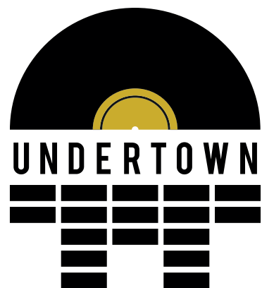
Patrick Eichenberger / OXSA